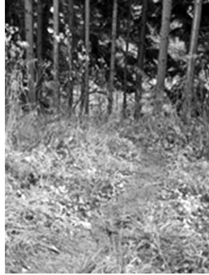
Autor: BUKO Campaign against Biopiracy

Frente a estas consecuencias, los agricultores, los investigadores y activistas de todo el mundo están buscando alternativas. Una posibilidad podría ser otro enfoque hacia el fitomejoramiento, basado en la interacción participativa entre productores, agricultores y otras partes de la sociedad junto a los principios del patrimonio común. En los siguientes apartados, se describe un posible nuevo enfoque. En primer lugar se describe brevemente el marco jurídico internacional sobre los Recursos Fitogenéticos para la Agricultura y la Alimentación (RFGAA) y a continuación se trata el concepto de patrimonio común tal y como fue investigado por Elinor Ostrom. Después se introducen los conceptos de